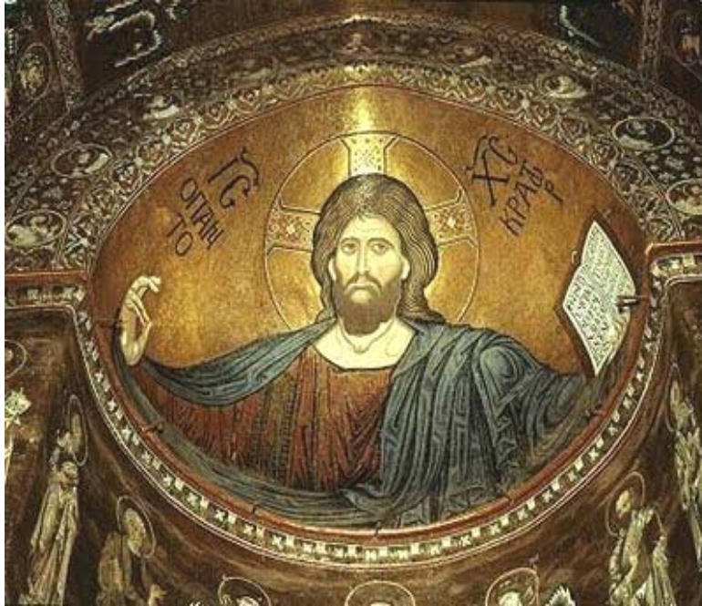
(Arte Bizantino. La catedral de Monreale)

Inicia en Bizancio en el siglo IV, inician las imágenes en los mosaicos, murales y pinturas en los techos de los templos, la arquitectura presenta los mismos elementos de los templos, la escultura es decorativa, se talla el marfil, nacen las artes menores: orfebrería, códices, telas, tapices de lino y lana hechos a mano, la pintura es religiosa y las imágenes más destacadas eran vírgenes. La literatura tenía influencia oriental pero con contenido cristiano.