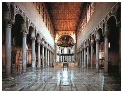
(Fotografía de arte paleocristiano; Templo de Santa Sabina, Roma).

Se hace oficial la religión cristiana y comienzan a construirse los primeros templos de influencia romana, griega y oriental. Al principio del cristianismo danza teatro y música se consideraban paganos, pero se introdujeron poco a poco a la liturgia y costumbres cristianas. Aparecieron los cantos llanos; el Papa Gregorio El Grande los seleccionó y se les llamó en su honor “ Canto Gregoriano ”. Se escribieron los primeros dramas religiosos que se presentaron en los templos.