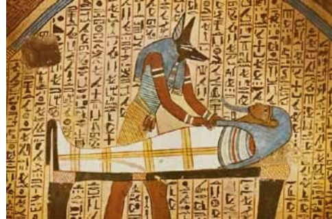
(Pintura Antigua de Egipto. “La momificación de acabado de Anubis. Tumba de Amennakht)

Se determinaron las manifestaciones artísticas por la forma de producción, gobierno y religión. Sus actividades estaban totalmente vinculadas a su religión. La pintura y escultura son realistas. Como característica seguían la ley de la frontalidad; cuerpo de frente y cabeza de perfil. Hicieron gran cantidad de monumentos en piedra y algunas en oro como representación de sus faraones. En fiestas se usaban instrumentos de viento y percusión acompañadas de danzas, rituales. Fueron ceramistas y orfebres.